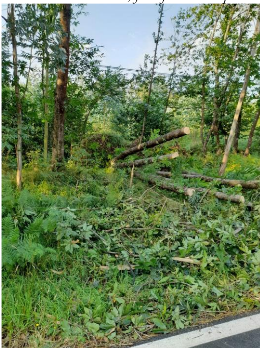
Fotografía das árbores tomada ó día seguinte do accidente, o 15/07/2022

O estado de conservación das árbores aparentemente era bó, non obstante o capataz manifestou que o motivo da caída do grupo de castiñeiros que orixinaron o accidente, foi o forte vento que existía nese intre.